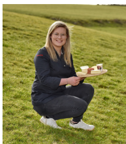
Marie Dogne Geitenboerderij en kaasmakerij (Stoumont)